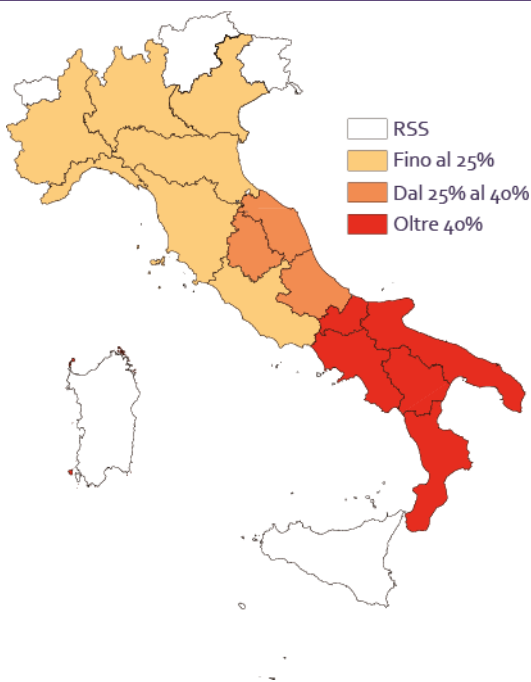
Figura 1 RAPPORTO TRA LA SPESA TOTALE PER L'ISTRUZIONE (PRIMARIA, SECONDARIA E UNIVERSITARIA) E IL GETTITO IRPEF. 2017 Valori percentuali

per finanziare l'istruzione (nel caso qui considerato), indipendentemente dall'età, dalle richieste e dalle necessità educative. La spesa media procapite è oggi differenziata tra Regioni, dai 700 euro della Calabria ai 470 dell'Emilia, a causa di più fattori quali, tra gli altri, la diversa composizione demografica, le caratteristiche dell'offerta, le caratteristiche della domanda, la diversa conformazione territoriale. I diversi costi dell'offerta del servizio possono essere dunque in parte o del tutto giustificati dalle differenze socio-economiche territoriali.